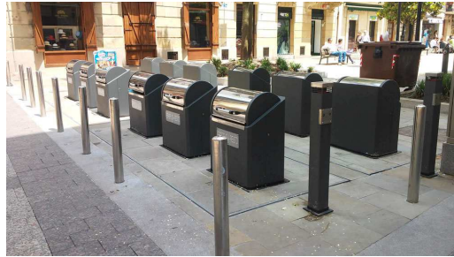
Exemple: conteneurs enterrés à San Sebastian (Espagne)

Enfin en parallèle de cette dernière étape, une campagne d'information et de sensibilisation vers les commerçants sera mise en place sur le tri sélectif et l'utilisation des conteneurs pour une gestion durable des déchets.