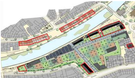
Localisation des logements du projet