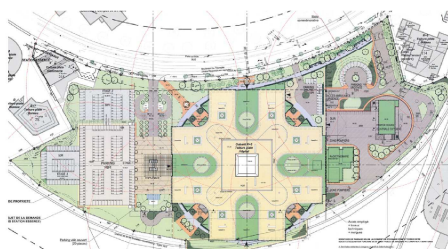
Projet soumis à étude d'incidences