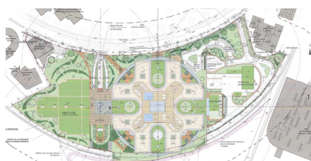
Projet amendé suite à l'étude d'incidences